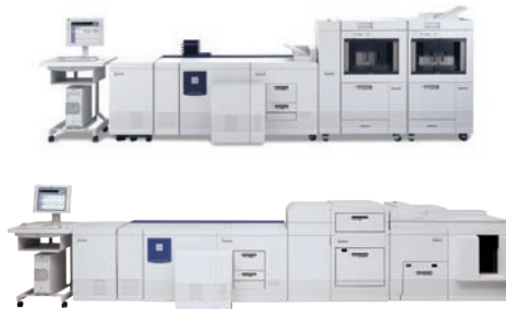
VIMM* : 100 000 à 2 M Une couleur supplémentaire : une infinité de nouvelles possibilités.