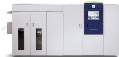
VIMM* : 1 M à 10 M Système en continu ultra-rapide, sortie monochrome haute qualité.