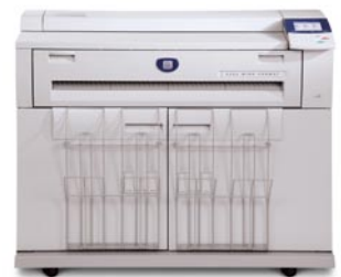
Configurations personnalisées pour les gros projets, les petites tâches et tous les travaux intermédiaires.